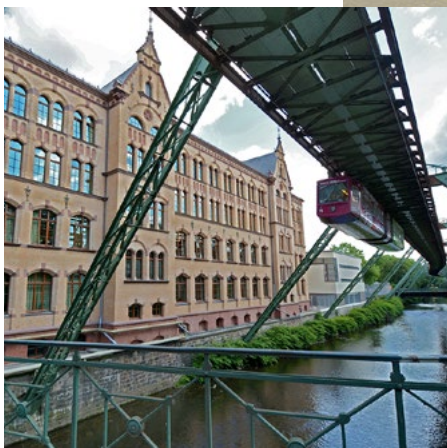
04 Berufskolleg am Haspel