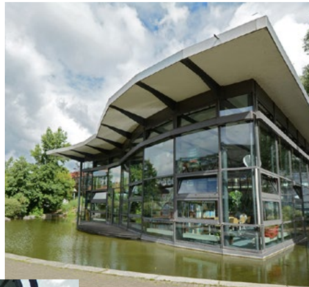
02 Realschule Neue Friedrichstraße